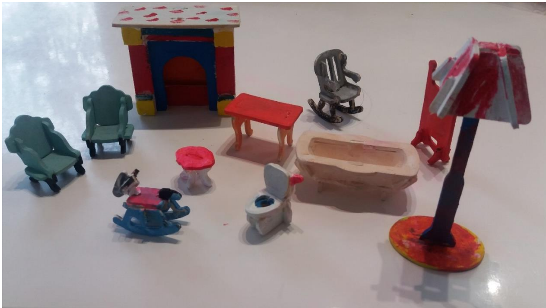
Mebelki wykonane przez Poleę.